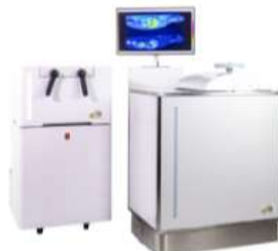
BeaQuant-S (左) と BeaQuant (右)